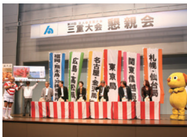
懇親会アトラクション「三重の税金クイズ」