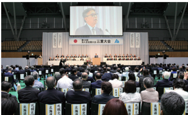
式典で挨拶する宮崎三重県連会長